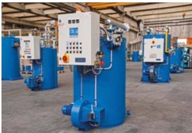
Caldaie TPC in costruzione