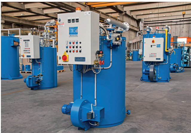
Meerdere TPC-Units in aanbouw